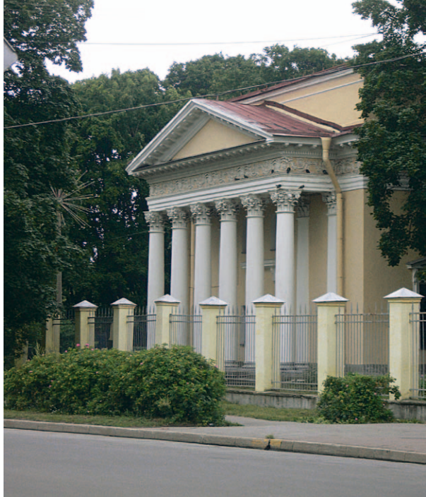
S:t Elisabets kyrka på Kronstadt. Nu med igensatt kyrkport.

andrew.x@webaid.se i samverkan med Nordisk Östmission.