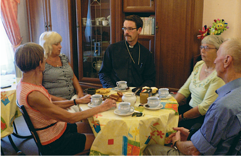
I samtal med föreståndaren för flickhemmet Masja.