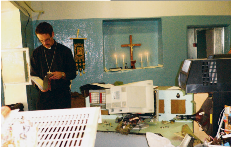
Interiör i samband med gudstjänst. Vattenverkets personal demonterar manöverbord.