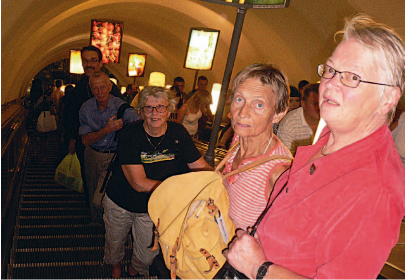
På väg ner i S:t Petersburgs djupa metro.