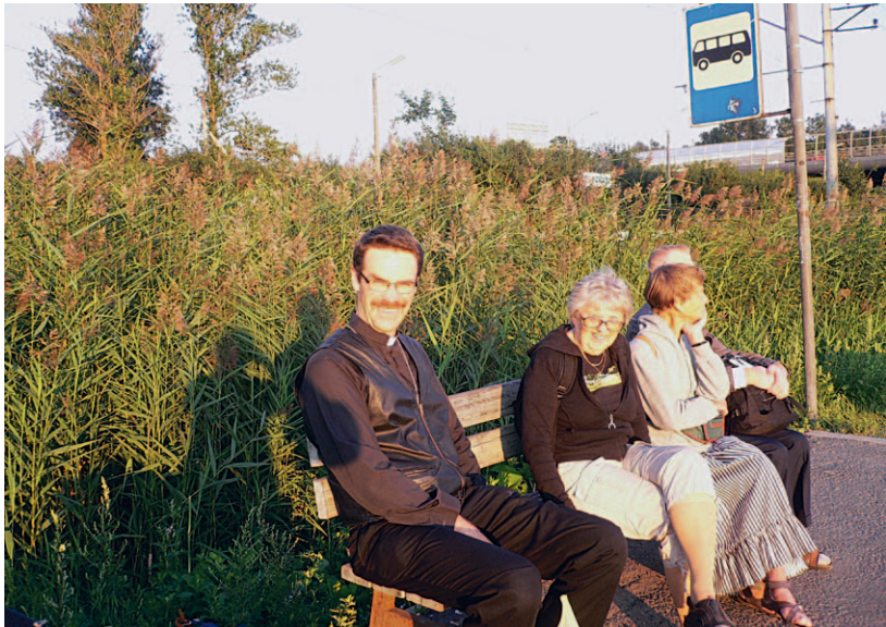
Vid busshållplatsen vid Kronstadtsbrons fäste, i väntan på bussen hem till Finland och Sverige.