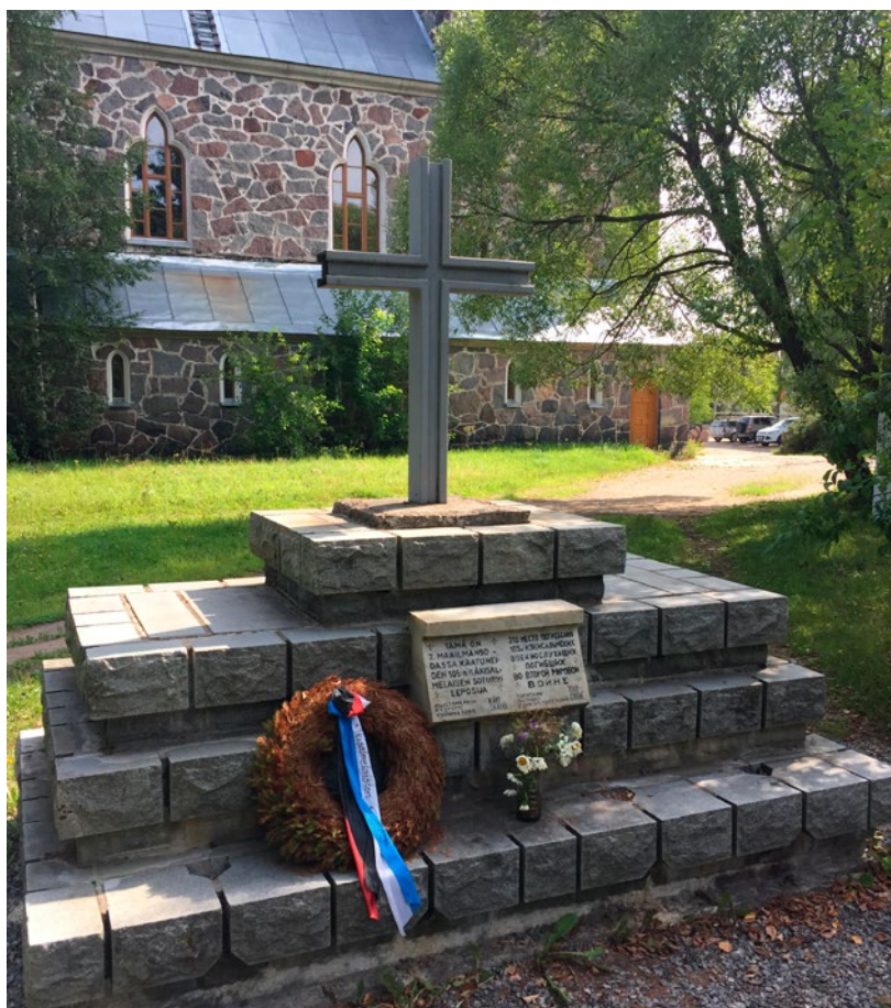
Krigsminne vid Kexholms finska kyrka