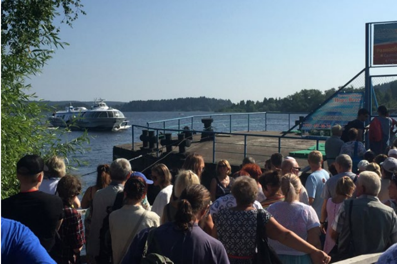
Valamobåt till och från Sordavala

dag kväll var till slut alla tillbaka på hotellet i Kexholm.