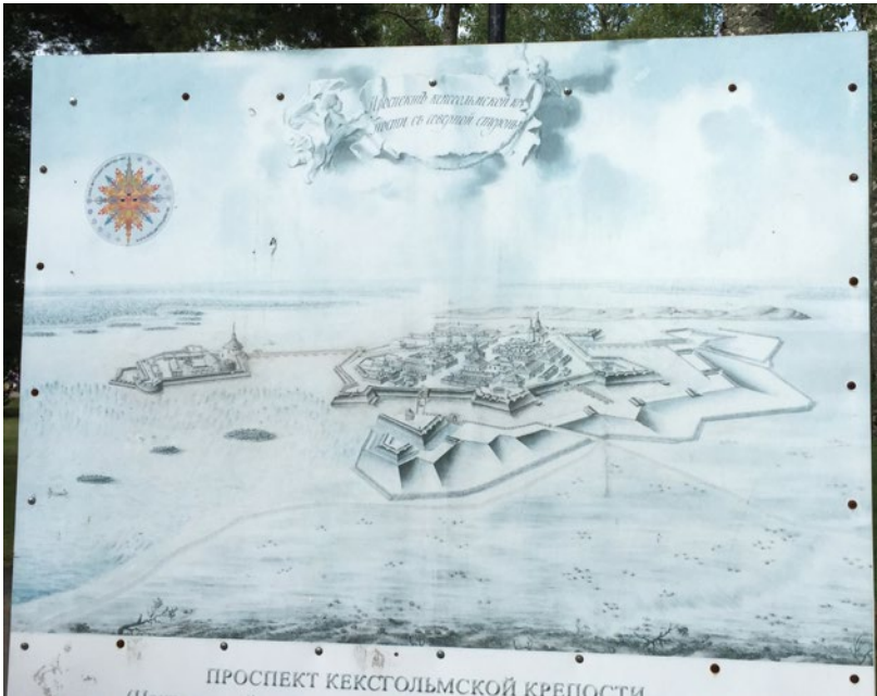
Historisk bild på Kexholms fästning.