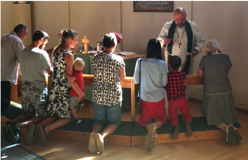
Kommunion i Sordavala.

Avståndet ut till Konevits ö i väster är litet i jämförelse med Valamo